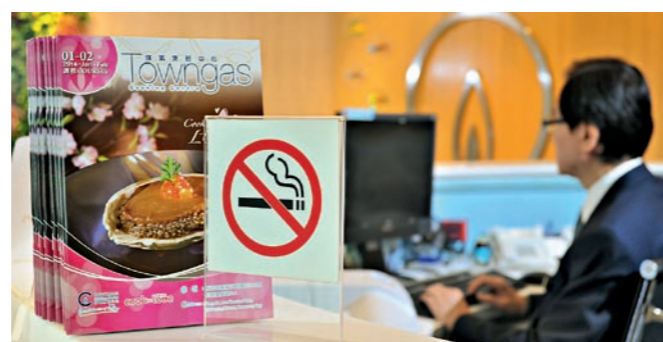
▲ 中華煤氣在陳列室放置了無煙標誌。 Towngas showroom put up no-smoking signage.

為響應「健康生活每一天」的年度主題，公司於2013年5月舉辦健康日，約200名同事踴躍參與。中華煤氣高級人力資源經理張子筠表示，活動邀請了九龍樂善堂「愛·無煙」計劃的註冊護士主講戒煙講座，即場派發戒煙小冊子及工作坊資料，並為同事進行基本身體檢