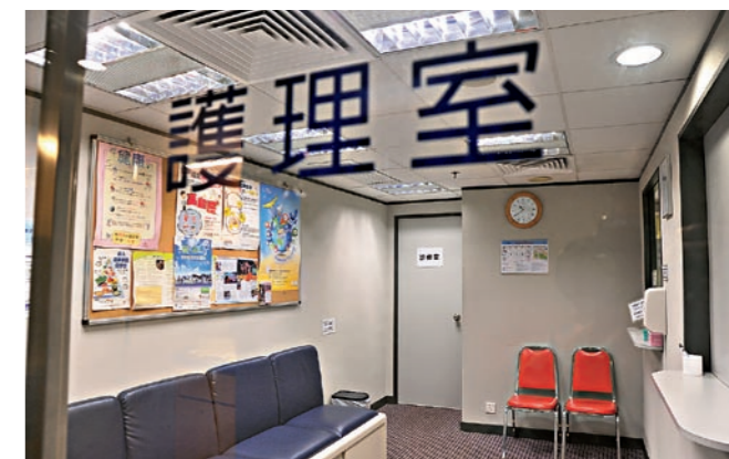
▲ 公司診所的醫生會主動了解吸煙同事的生活習慣，提供戒煙方法。 Doctors at in-house clinic will understand the smoking habit of employees and suggest ways to quit.